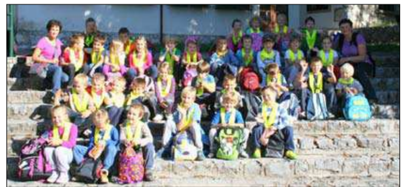
Prvošolčki na Kekcu