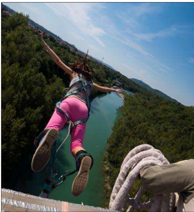
1, 2, 3 Bungee!