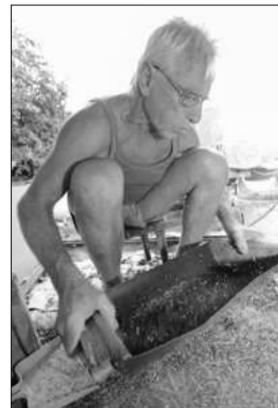
Poletje je čas, ko regut odcveti in seme dozori. Vestni pridelovalci ga spravljajo pod streho, najbolj hitri med njimi pa tudi že tučejo in si pripravijo seme za naslednjo setev.