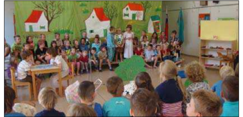
Prvi dan v hramu učenosti