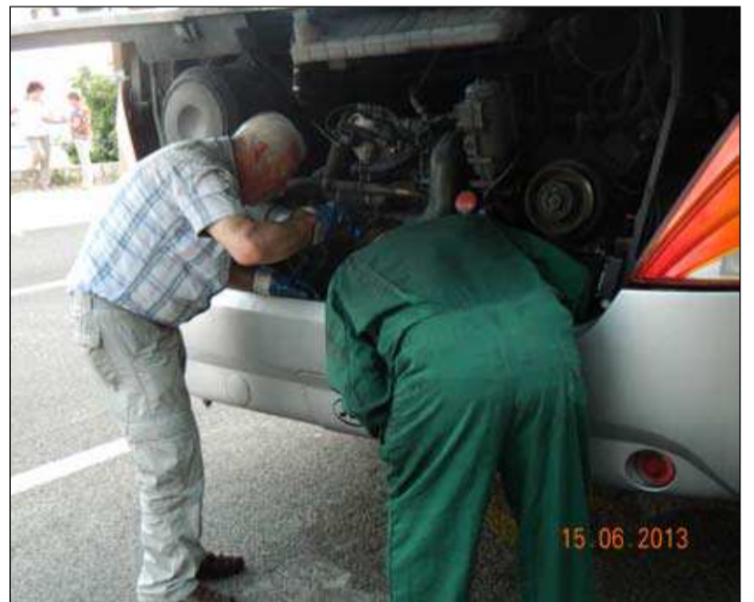
Med upokojenimi potniki so na srečo tudi mehaniki.