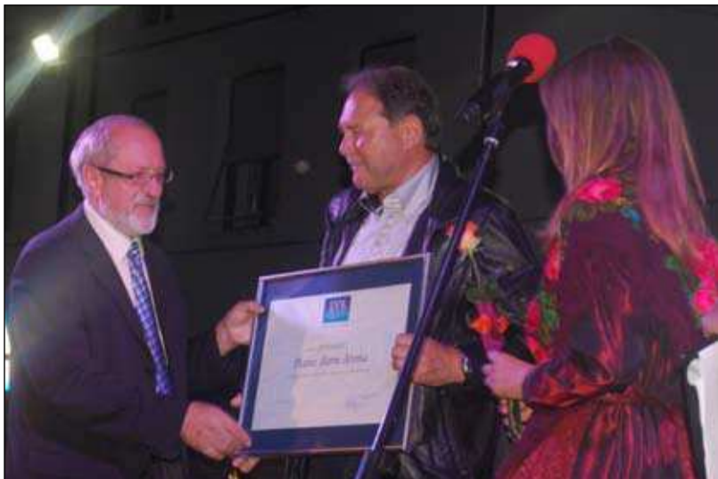
ARENA PIANO BAR - za bogatitev Solkana z glasbeno kulturo, zabavo in izbrano gostinsko ponudbo

Prejemniki priznanj KS Solkan v letu 2013 so: