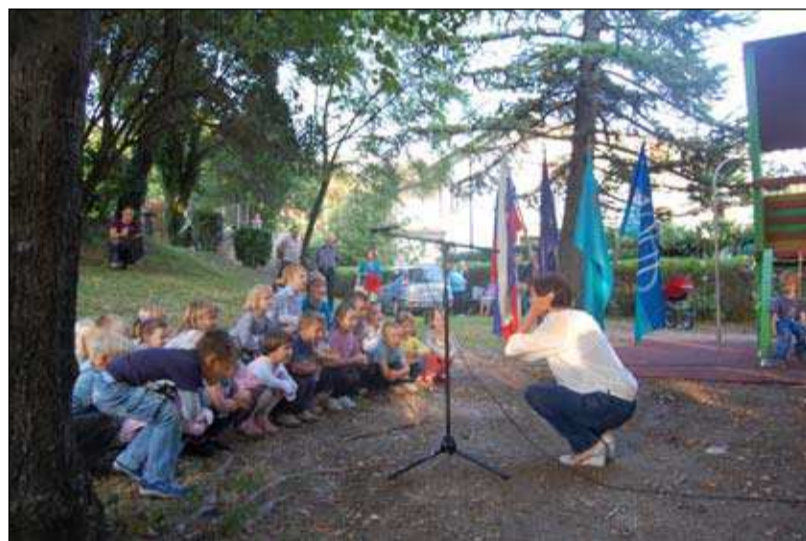
- in obenem telovadijo.