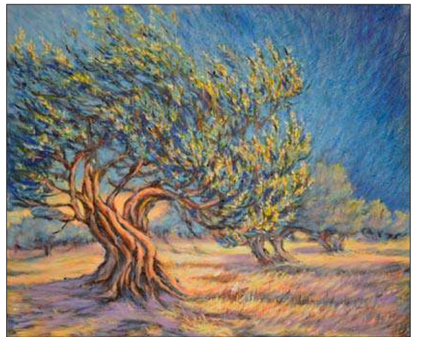
Slikarko navdihujeta predvsem trta in oljka kot večni simbol miru in življenja.