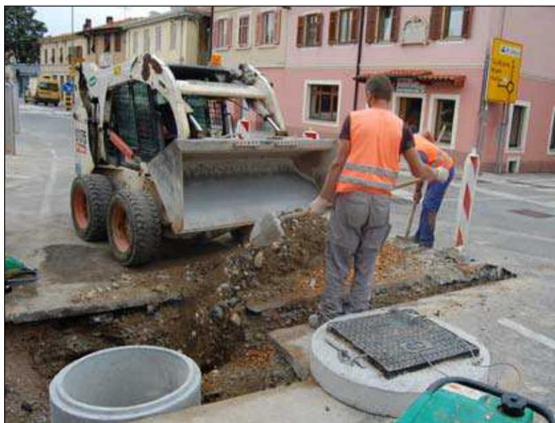
Prekopavanje. Tokrat za optične kable. Na srečo delavci hitijo. Vsako luknjko pokrijejo že skoraj prej kot jo izkopljejo, ampak ceste in pločniki so vseeno pokrpani, kot beraške hlače.

TURISTIČNO DRUŠTVO SOLKAN vabi dne 26. oktobra 2013 na: