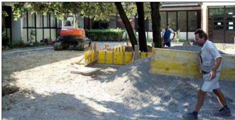
Šola med počitnicami - prenovljena ploščad pred vhodom v šolo