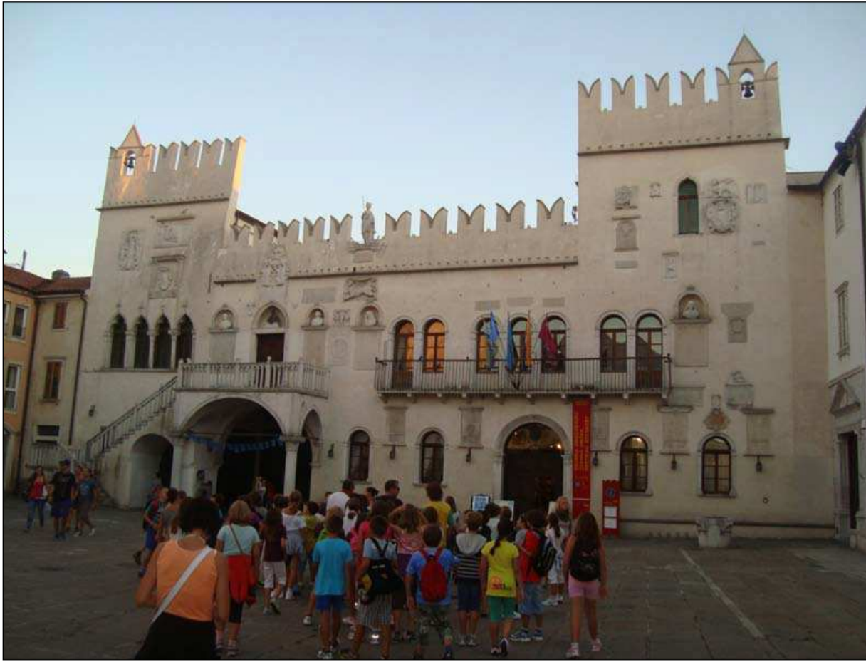
Med ogledom Kopra

Medtem ko smo že vsi sedeli v šolskih klopih in pridno začeli s šolskim delom, so si naši petošolci za pet dni podaljšali užitek ob morju. Prvi šolski dan so se odpeljali v Žusterno, kjer so plavali, spoznavali morsko obalo, aktivno sodelovali pri raznih športnih igrah na vodi ter se rekreirali in popolnoma izkoriščali sončne septembrske dni. EG