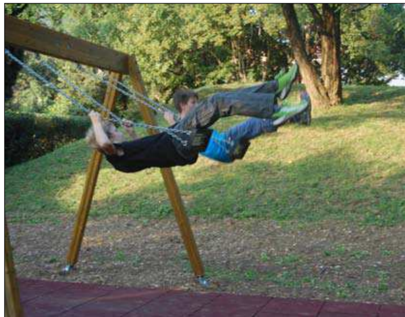
Visoko, višje, najvišje