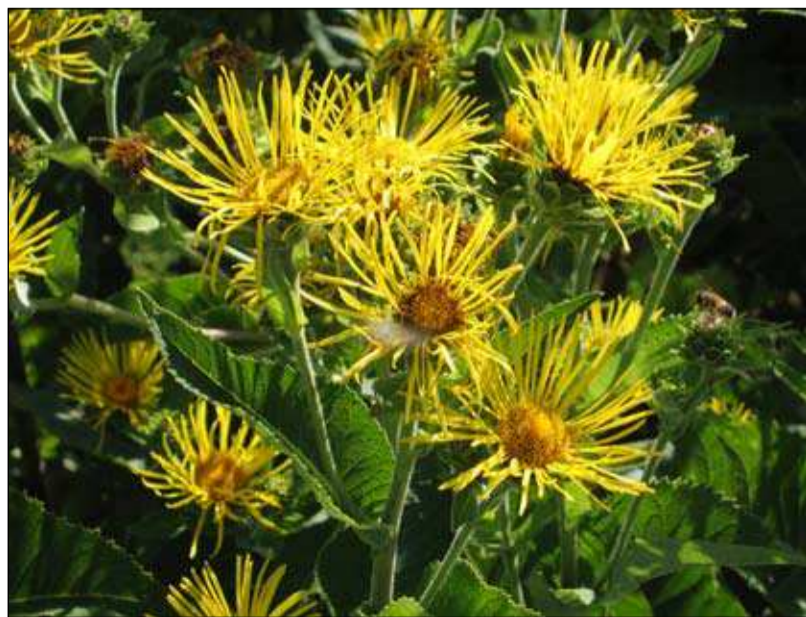
Cvetovi velikega omana