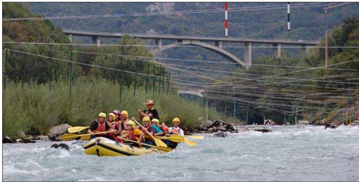
Pod žicami čez brzice

Bilo nas je že več, pa tudi manj. Tudi vodostaj je bil že višji, pa tudi nižji. Letos - ravno pravšnji. In imeli smo se lepo. Veslali, se zabavali, tudi plavali. Postanek pri prijateljih čez mejo, ki nas sredi poti pogostijo s piškoti, čajem in kozarcem rujnega briškega vina, se vedno spleča. Zaključek v Podgori pa je itak prava fešta, na kateri si večina zbranih obljudi: Naslednje leto spet. (TG)