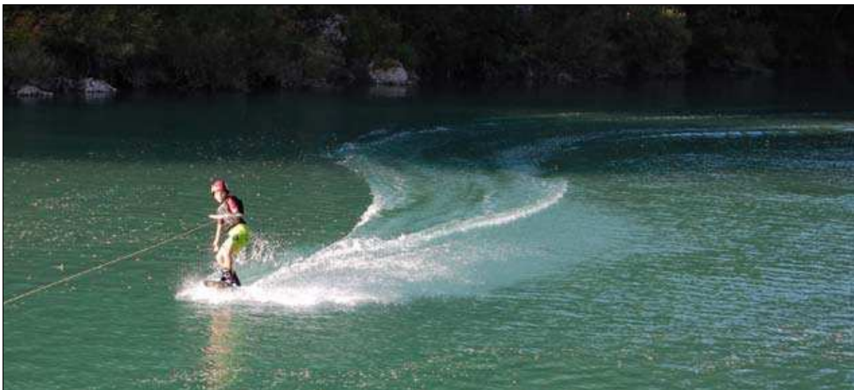
Smučanje na vodi. Vrv je vlekel vitel z brežine, postavljen na Hipi skali

Poletje. Solkan. Soča. Enobesedne povedi, ki zaznamujejo naše življenje. Iz leta v leto, že desetletja in stoletja. Tisočletje in več. Vedno je vse enako, vedno nekaj novega. Letos smo se ponovno prepričali, da je Soča reka, ki zahteva spoštovanje. Ki nas ljubi, vendar ne oprošča napak. Je zahteven soigralec. Nanjo se je potrebno privaditi. Korak za korakom, potem nam je v neizmerno veselje.