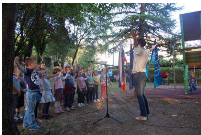
Malčki prepevajo -