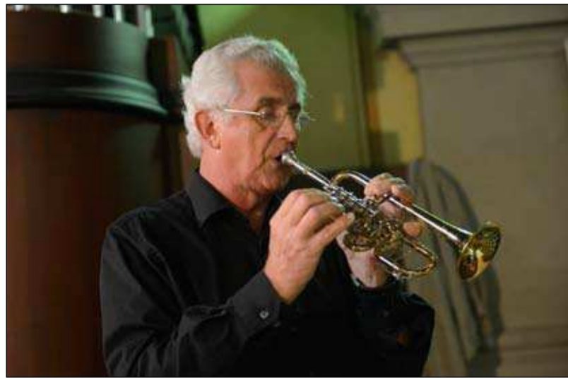
Zvok nebeške trobente je preglasil orgle.

Ob suverenem muziciranju orgel, ki so zaznamovale celoten koncert in so se ob zvokih trobente umaknile v ozadje, se je zazdelo, da slišiš glas nebeške trobente. Prelivanje zvokov glasbil sta združila v popolnost zamejni bariton in skladnost soprana s trobento. Globoka tišina je dala slutiti, da nas je glasbeno izvajanje popolnoma prevzelo in seglo do najgloblje bista, do srca, do duše. Na tem svetem kraju smo tudi sami začutili resni-