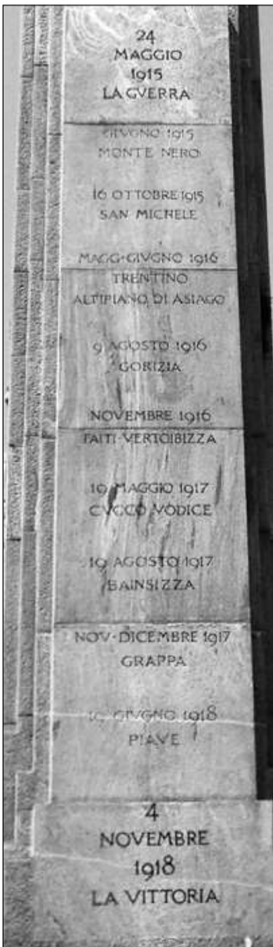
Obelisk "od vojne do zmage"