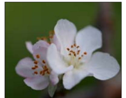
Cvetje v jeseni: jablana na Dragah.

1 stran: 400 evrov, 1/2 strani: 200 evrov, 1/4 strani: 100 evrov, 1/8 strani: 50 evrov, manjši oglasi: 25 evrov. Oblikovanje oglasa: dodatnih 50 % Oddaja oglasnih vsebin za naslednjo številko: 1. december 2013.