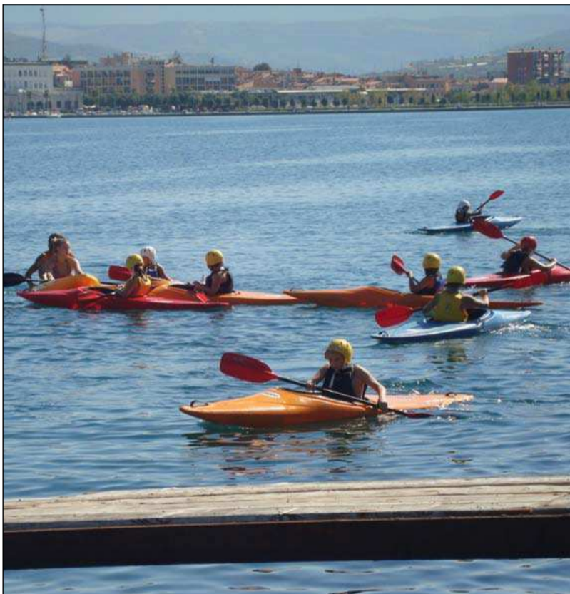
Veslanje v kajakih