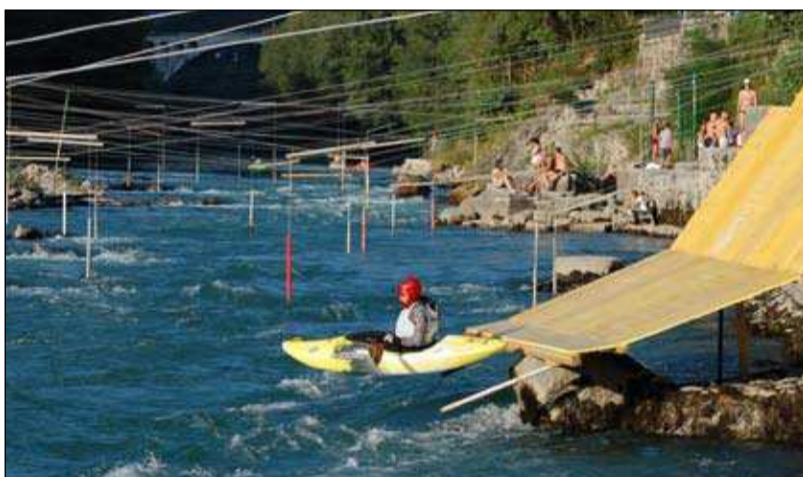
V zraku