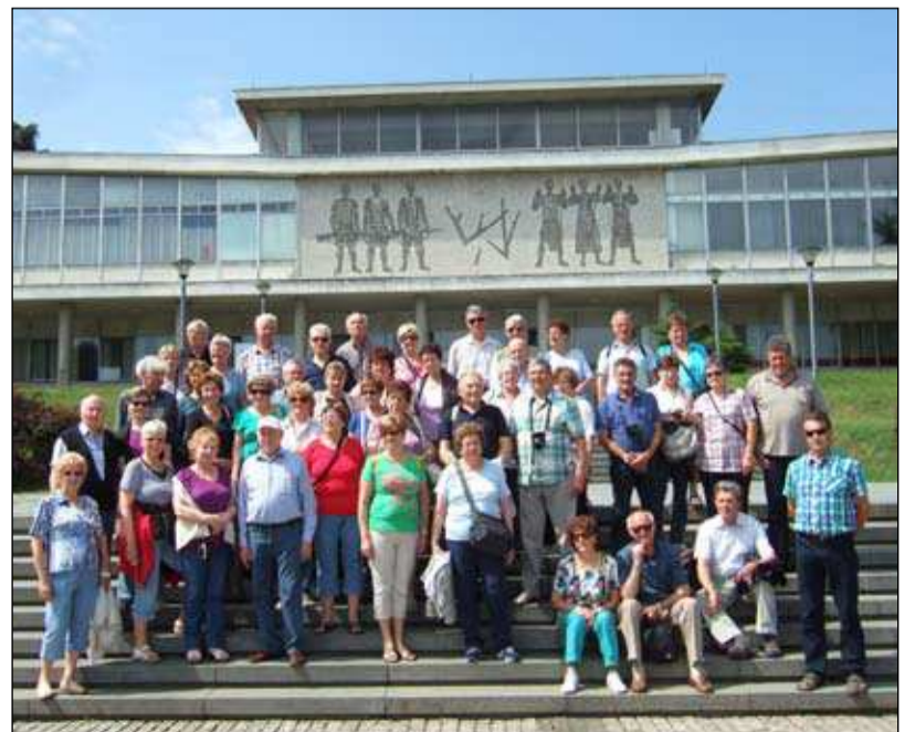
Skupinska - gasilska pred muzejem 25. maja