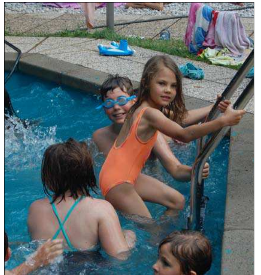
Kopanje v malem bazenu je priprava na plavanje v Soči.

ŠD Sonček je tudi letos pripravilo priljubljeno enajsto šolo, v kateri so se malčki igrali, plavalili v bazenu in v Soči, se učili kajakaških veščin, iskali dobre prijeme v plezalni steni in se v glavnem lepo imeli. TG