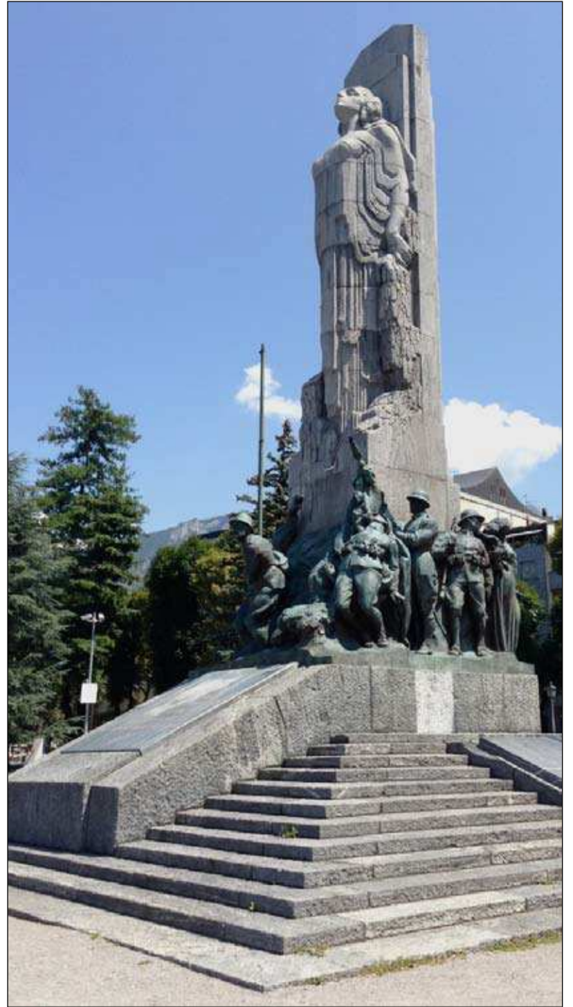
Komu danes zvoní?