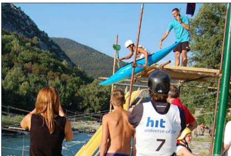
Odriv Kanclerja Tamladega

Med Dnevom Soče je le za par metrov zgrešil jez in pristal v vodi jadralni padalec. Mnogi so mislili, da gre za del programa. Pa ni bil. Nenačrtovani pristanek je izvedel nemški padalec, udeleženec tekmovanja Germany Open, ki so ga presenetile slabe jadralne razmere nad Sabotinom. Ni bil edini - le da je ostalim uspelo pristati na Dragah.