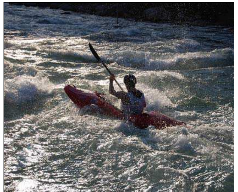
Vestern po sukensko: glavni junak odkajaka v sončni zahod.

1001 – solkanskega časopisa bo izšla 24. decembra 2013. Članke in fotografije je potrebno oddati najkasneje do 5. decembra na e-naslov: 1001solkan@gmail.com . Besedil, ki niso v elektronski obliki, ne moremo sprejemati. Kontaktna številka urednika: 040 201 213.