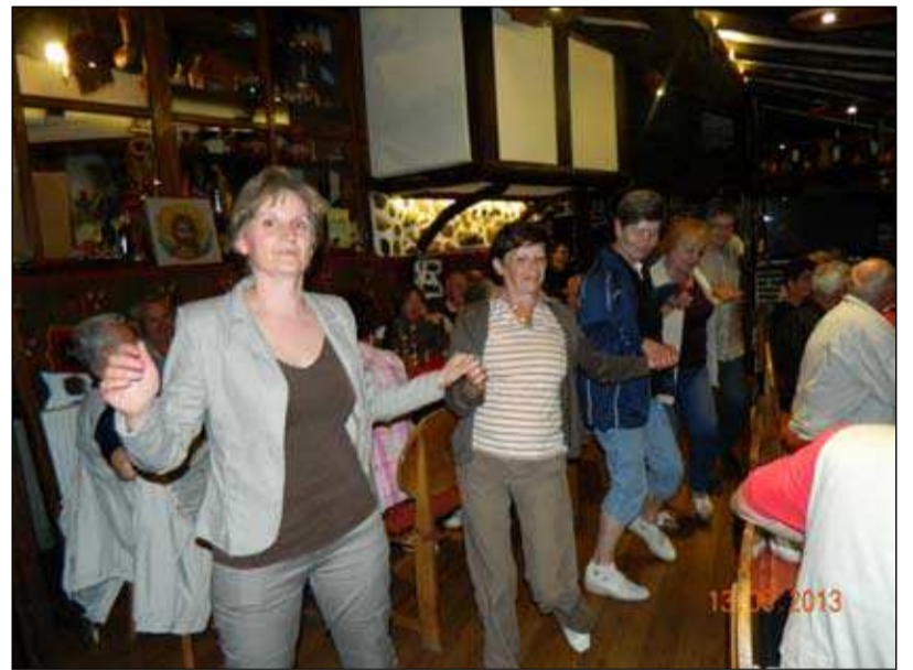
Oro v Vevčanah