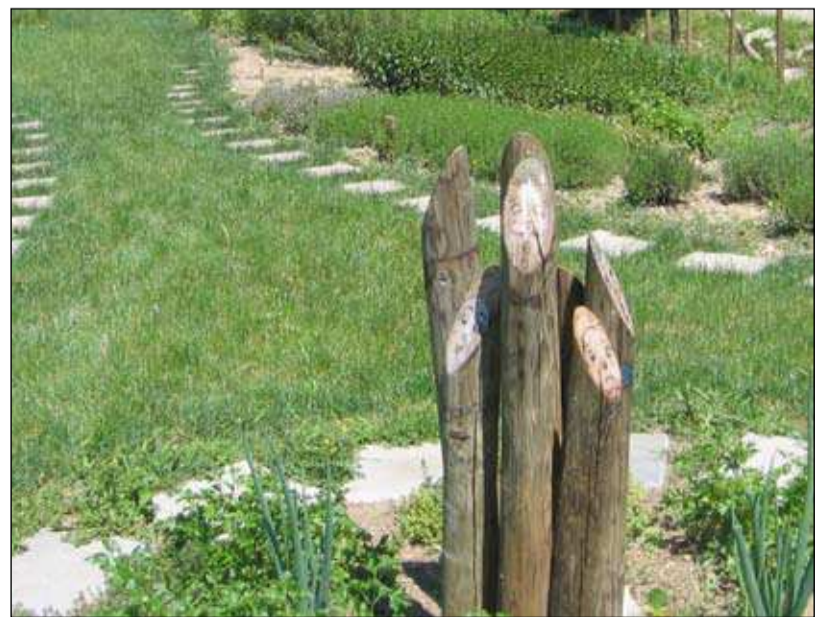
Palčki in palčice