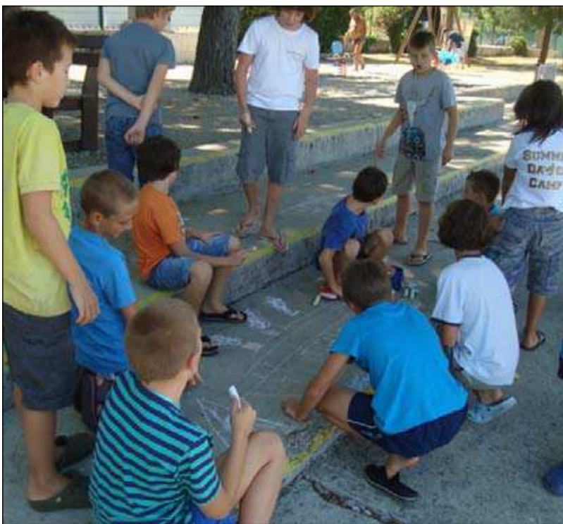
Risanje z barvnimi kredami na plaži