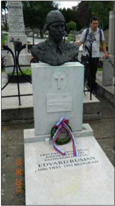
Ob spomeniku Edvarda Rusjana