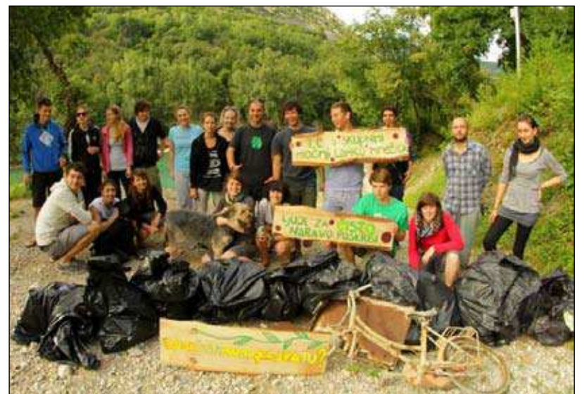
Udeleženci čistilne akcije pozirajo po uspešnem lovu na smeti 2013.